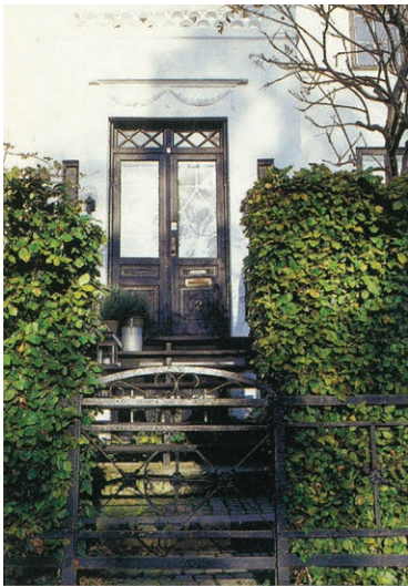
Indgangspartiet med smedejernslåge og trappe op til den sortmalede hoveddør giver mindelser om engelske rækkehuse.