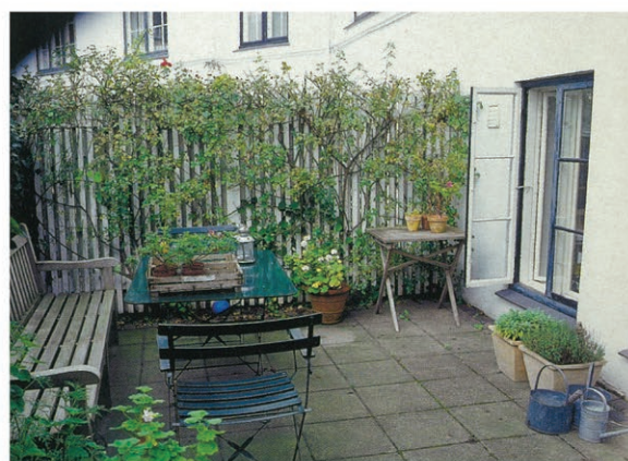
Lige uden for køkkenvinduerne ligger rækkehusets lille gårdhave, som er et privat område inden for bebyggelsens store, fælles gårdareal.