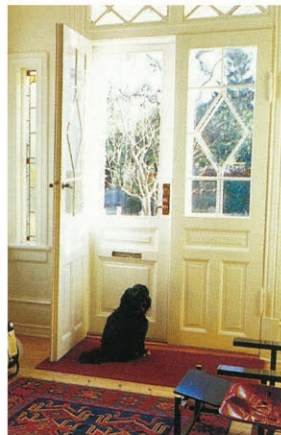
Det smukke indgangsparti med blyndfattede ruder er et typisk træk ved de engelske rækkehuse.