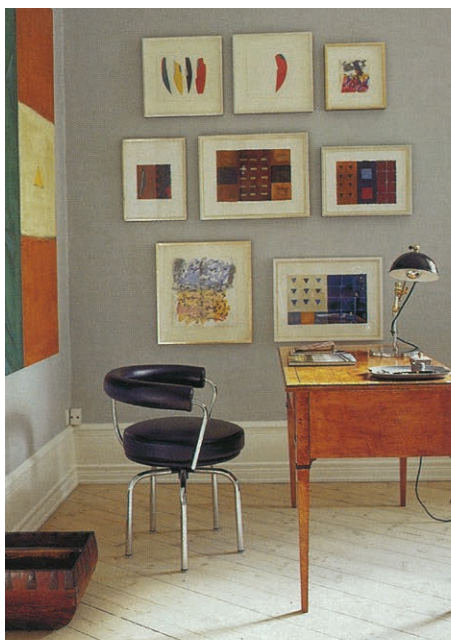
Et hjørne i den blå stue, er møbleret med et antikt skrivebord og en Le Corbusier-skrivebordsstol. Væggene er viet til billeder af amerikanske kunstnere, som alle er nære venner af huset.